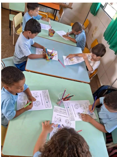
Foto 11- Atividade Pedagógica

Atividades executadas com as crianças atendidas: Elas participaram de diversas atividades educativas que ajudam na construção da sua autonomia e identidade, desenvolvem atividades pedagógicas e lúdicas que são preparadas pensando no bem-estar físico e social da criança. As turmas foram divididas em agrupamentos por idades, conforme as Diretrizes da Secretaria Municipal de Educação. O nível de atendimento foi a Educação Infantil, nas modalidades de Creche e Pré-Escola em tempo parcial. Sendo assim, foram formados: 03 agrupamentos de 3 anos, 02 agrupamentos de 4 anos 03 agrupamento de 5 anos. No período matutino as aulas iniciam às 7:00 horas e terminam às 11:15 horas, no turno vespertino as aulas iniciam às 13:00 horas e terminam às 17:15 horas.