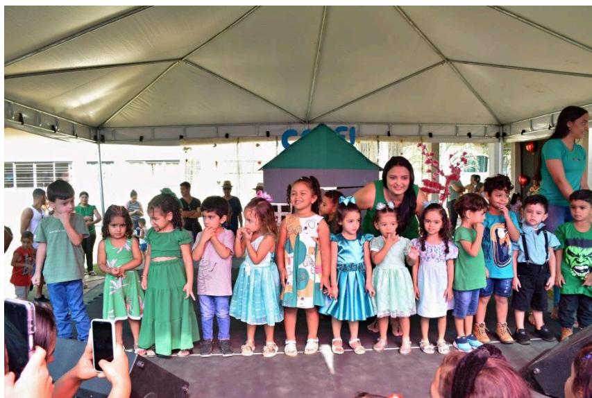
Festa da Família – Apresentação de dança