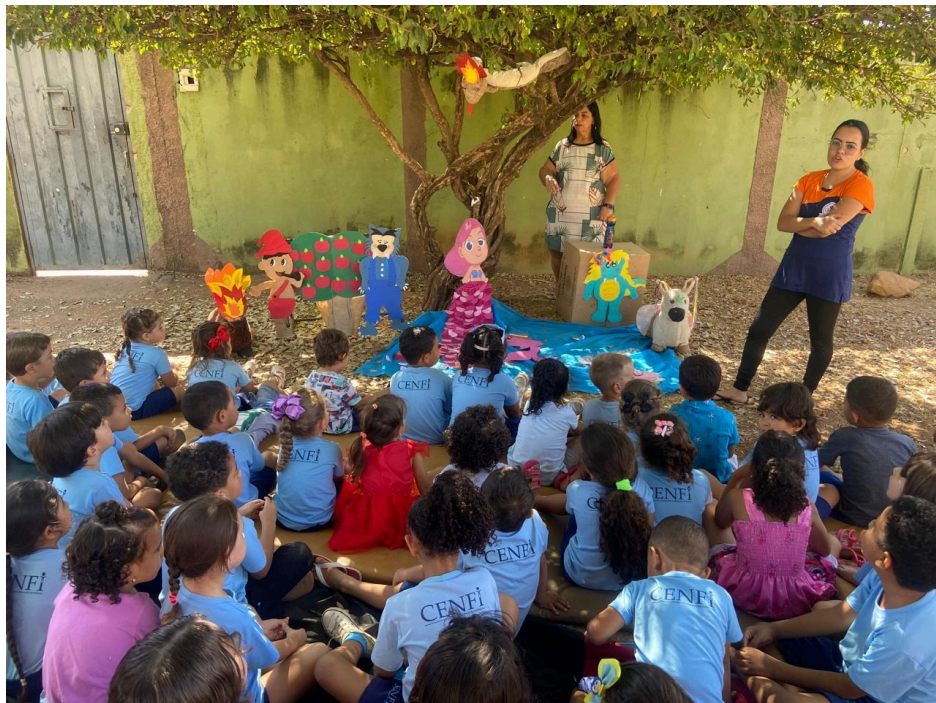
Projeto de Literatura Infantil