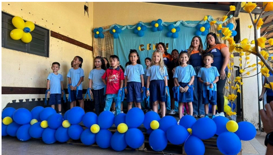
Aniversário do CENFI – 31 anos Apresentação musical