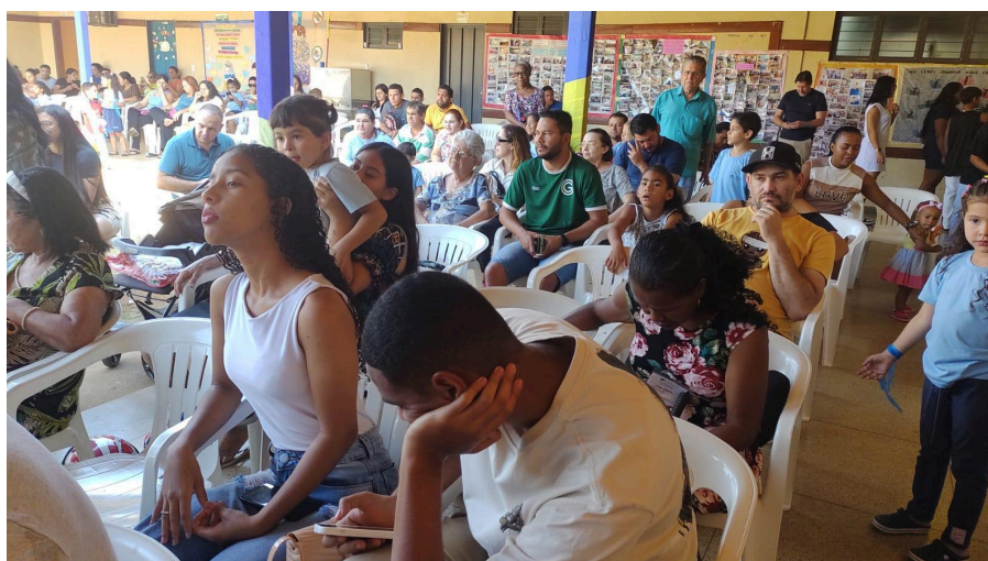
Aniversário do CENFI – 31 anos