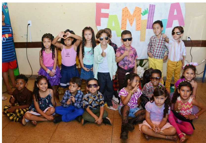
Apresentação Musical Festa da Família