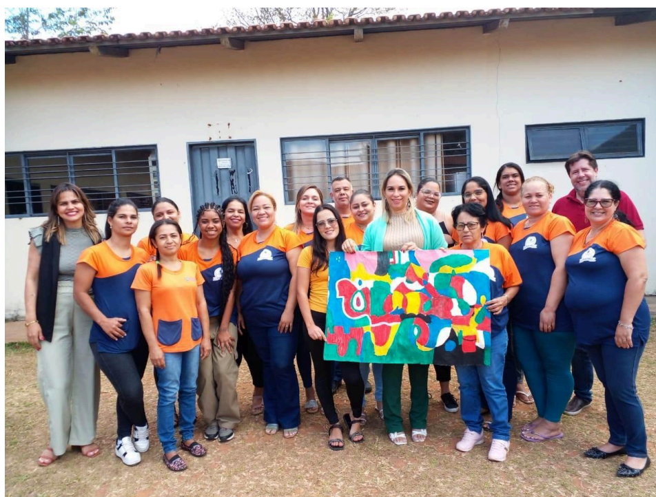
Foto 10 - Equipe de Trabalho