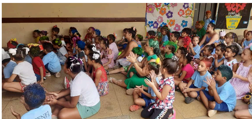
Semana da Criança – Dia do Cabelo Maluco