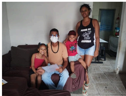
Foto 15- Visita Domiciliar